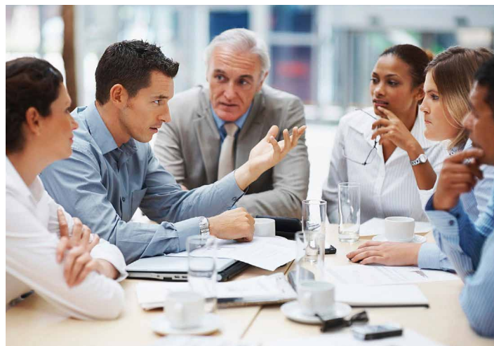
'Naar kantoor gaan' zal in de nabije toekomst een nieuwe invulling krijgen

Het zijn turbulente tijden voor de facility managers. Ze moesten zich al staande houden in de lawine van nieuwe noden en vereisten, maar Covid-19 heeft de kaarten helemaal door elkaar geschud. Dé uitdaging van morgen is een minimum aan werkposten te combineren met een maximaal comfort. Binnen het kader van optimale energie-efficiëntie wel te verstaan. Dit is enkel mogelijk door het gebouw om te tunen tot een datagenererende machine die bovendien zelflerend is en autonoom intelligente beslissingen kan nemen.