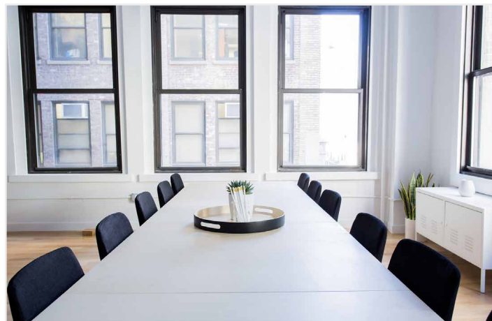
De uitdaging van morgen is een minimum aan werkposten te combineren met een maximaal comfort.

ring te bieden die ze voor ogen hebben. Mensen zullen met het gebouw communiceren en vice versa. We denken bijvoorbeeld aan apps om een parkeerplaats, werkplek of laadpaal te reserveren, maar eveneens aan systemen waarmee defecten kunnen worden gemeld. Omgekeerd zal de gebouwtechnologie aan de facility managers of servicebedrijven melden dat er iets fout loopt of zelfs predictief aangeven dat een ingreep zich opdringt. Zo worden problemen in de kiem gesmoord, wat een kostenbesparing oplevert en het comfort van de aanwezigen garandeert. Het laat facility managers toe om de zaken efficiënt en doelgericht aan te pakken in plaats van met een kanon op een mug te schieten om toch maar de noodzakelijke service te kunnen aanbieden. Toch hebben niet alle (bestaande) gebouwen de juiste basis om deze manier van meten en opvolging toe te passen. Een goede manier om dit in kaart te brengen, is het bepalen van de SRI-score (Smart Readiness Indicator) van een gebouw. Op basis daarvan kunnen specifieke investeringen worden gedaan om het gebouw naar een hogere SRI-score te brengen. Dit zal ervoor zorgen dat het bijvoorbeeld aantrekkelijker wordt op de vastgoedmarkt of dat facility managers betere handvaten krijgen om het gebouw te beheren. Om die reden zie ik de SRI een belangrijke verkoopstool in de vastgoedsector worden."